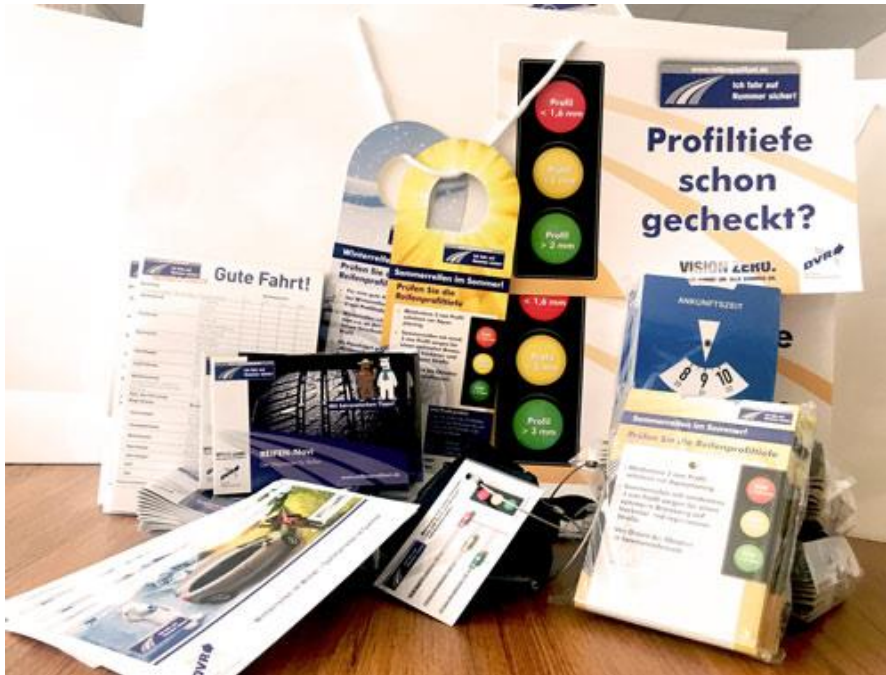
Bildunterschrift: Aktionspaket der Initiative Reifenqualität zum Tag der Verkehrssicherheit