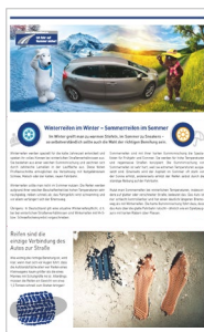
Flyer „Sommerreifen – Winterreifen“