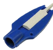
Reifenprofilprüfer mit Ventilkappendreher

Grafische Gestaltung unter Vorbehalt. Tatsächliche Gestaltung kann abweichen.