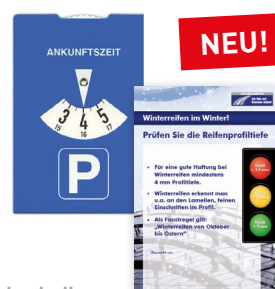
Parkscheibe „Profiltiefe Winterreifen“