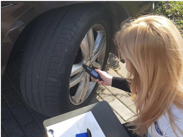
Foto: Kostenloser Reifendruck im Rahmen der Wash&Check-Aktion